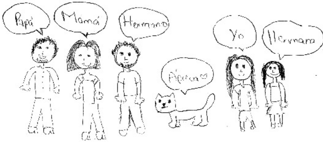
Fig. 5. Familia