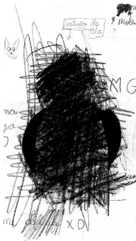
Fig. 3. Retrato