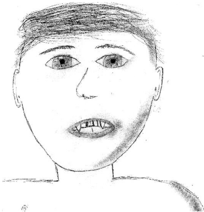
Fig. 1. Retrato