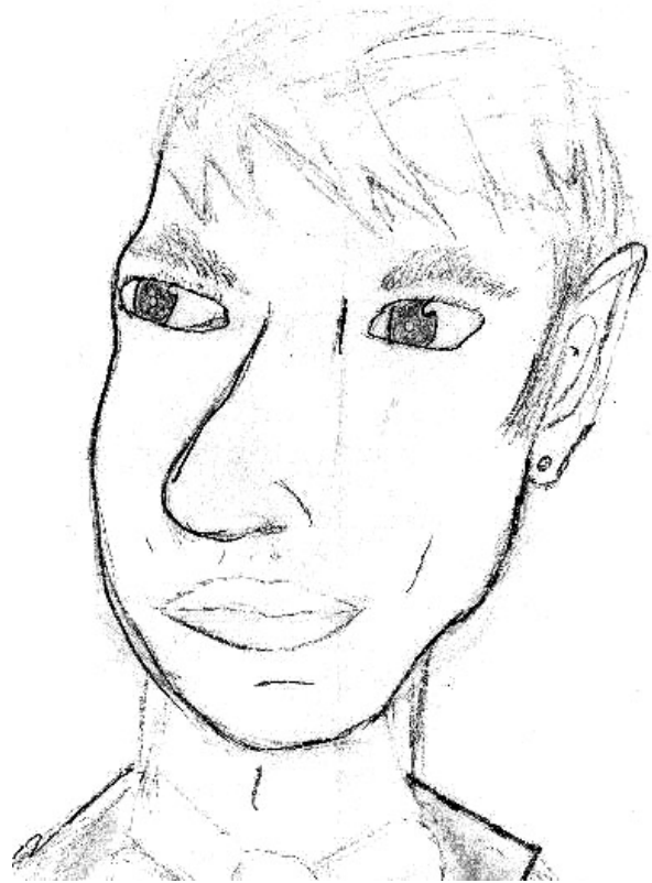
Fig. 2. Retrato