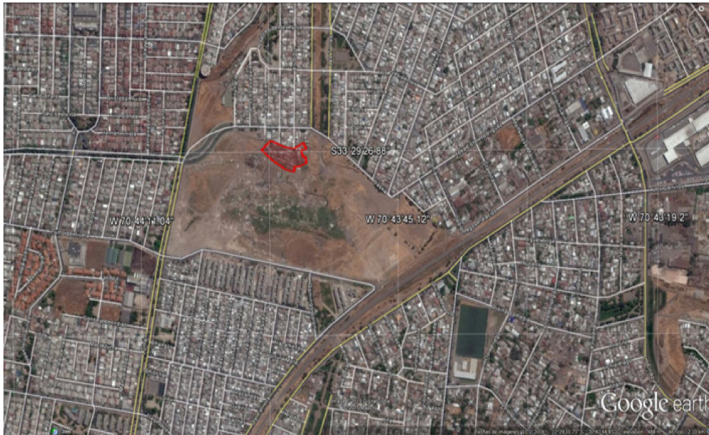
Figura 1: Localización del Campamento Japón, Comuna de Maipú (Santiago de Chile)

* El polígono rojo delimita el Campamento Japón.