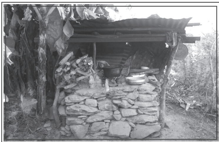
Fotografía: Fogón tradicional de Aguas Calientes (2010).