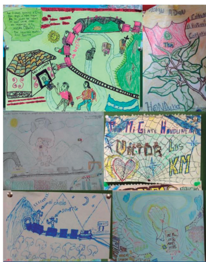
Figura 5. dibujos creados por niños migrantes en Tuxtla Gtz.

En el caso del Refugio Temporal para Niños y Niñas Migrantes No Acompañados en Tuxtla Gutiérrez, se ha identificado una carencia significativa en la provisión de educación formal. Este albergue, que acoge a niños y adolescentes de entre 2 y 17 años con 11 meses, no dispone de un docente de base. La falta de un profesional educativo conlleva serias implicaciones, dado que la enseñanza varía considerablemente según el grupo de edad, desde niños de 5 años hasta adolescentes de 14 años. La ausencia de un docente limita gravemente la capacidad de ofrecer una educación adaptada a los diferentes niveles académicos requeridos. Además, la sala asignada como aula se utiliza con frecuencia para mantener a los niños sin actividades educativas específicas, limitándose en el mejor de los casos a la entrega de material para colorear.