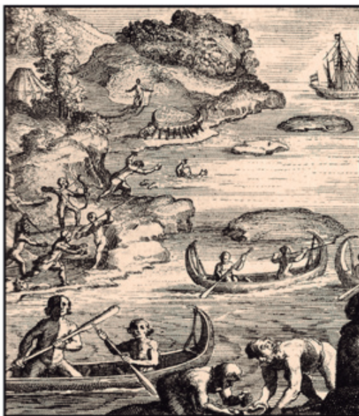
Figura 3. Composición gráfica que combina una breve aproximación a la mayor parte de observadores y fechas aproximadas (Izq.); (Dcha.) el detalle de la representación de los canoeros de Tierra del Fuego durante la expedición de Nassau, 1624. Fuente: (Izq.) Elaboración propia y (Dcha..) detalle de Expedition de Nassau - Jacques L'Hermite - Tierra del Fuego, 1624. Theodor Bry.

Por otro lado, la información etnográfica y arqueológica ha propiciado destacables trabajos previos acerca de las mujeres yámana de Tierra de Fuego sobre su papel como tejedoras y curtidoras, entre otras “labores que complementaban la actividad económica del sector masculino de la población” (Chapman, 2012: 229), lo que en algunos casos, subrayaban una relación asimétrica