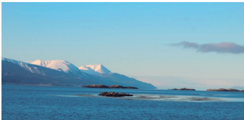
Figura. 1 Canal de Beagle u Onashaga durante invierno. Ushuaia, Argentina (2023)

relacionada con uno de los cuatro grupos de Tierra del Fuego: yámana, kawésqar, selknam o haush (Massone, 1987: 42). Sin embargo, sin vinculamos mujer y cultura náutica/marítima, circunscribimos la referencia a los dos grupos canoeros por excelencia, centrando el análisis con especial profundidad en las mujeres yámana, pero pudiendo hacerlo extensivo a las mujeres kawésqar por proximidad espacial, temporal y cultural (Orquera y Piana, 1999: 171 nota 67) (Ver figura. 1). Se trató de grupos de un nomadismo en su más elevada expresión —“cada familia disfruta de la máxima independencia” (Bove, 1883: 130)—, pues se desplazaban en canoa la unidad mínima de organización social con el fuego a bordo (Haro, 2015: 8); y en cierta forma, gozan de soberanía política la mayor parte de su vida. Vargas (2004: 216); en busca de pinnípedos, cetáceos vulnerables, cardúmenes de pescado y un largo etcétera de vida marina austral, que proporcionara los recursos proteicos necesarios para la subsistencia en condiciones sumamente frías como refiere Gusinde (1986).