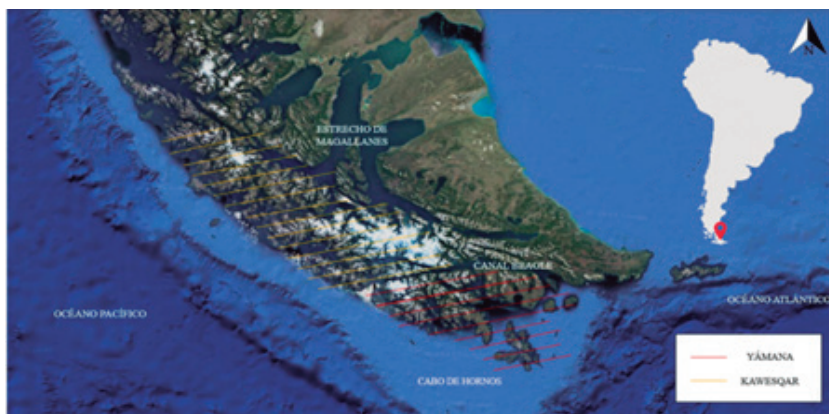
Figura 2. Mapa de Tierra del Fuego y una aproximación a los hábitats históricos yámana (rojo) y kawésqar (naranja).

de Magallanes (Nieva, 2022), dado que al paso de la expedición que más tarde culminaría la primera vuelta al mundo (1522), Antonio de Pigafetta ya resaltó esos numerosos humos que acabarían por motivar el nombre del archipiélago (Pigafetta, 2017: 33). Este se compone por las estribaciones más meridionales de la cordillera de los Andes, cuya distribución fragmenta el territorio en numerosas islas e islotes montañosos circundados por fiordos y canales, teniendo al oeste el océano Pacífico y el océano Atlántico al este, y estando sometido a una influencia climática subantártica que condiciona de forma muy incisiva la fauna, la flora y la cotidianidad de los grupos humanos que otrora habitaron estas latitudes (Conte, 2008) (Ver figura 2).