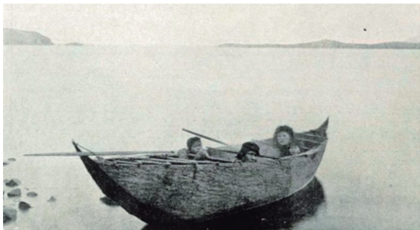
Figura 4. Fotografía de familia fueguina a bordo de su canoa. Mujer e hija en popa.

público y ámbito doméstico/privado y su relación con hombre y mujer, respectivamente; lo que al situar las actividades náuticas en el ámbito público limitaba, por ende, el papel de la mujer (Subías, 2000: 48).