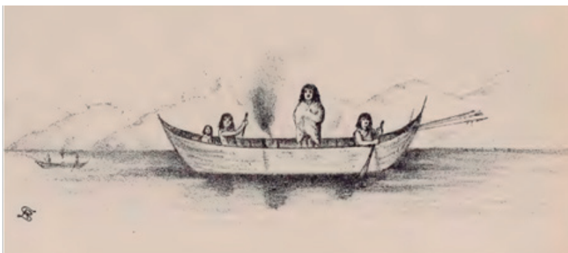
Figura 6. Dibujo de familia yámana a bordo. Véase madre e hija en popa. Fuente: Dibujo de Giacomo Bove, 1883: 135-136.

entregadas a las niñas (Vargas, 2004: 232). Es precisamente el juego el instrumento fundamental de enseñanza en los niños durante su proceso de socialización (Mead, 1993), propiciando el establecimiento de pautas y roles sociales que acabaran consolidándose a través de los mitos y los rituales de paso, siendo el contexto yámana el Čjěxauš para ambos, y el Kina solo para varones (Bridges, Thomas 1998: 153 y Gusinde, 1986: 1286).