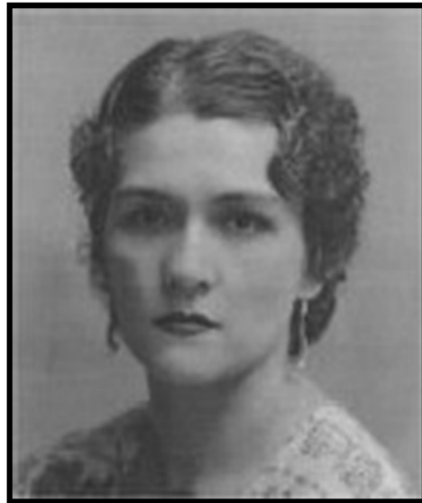
Ilustración 2. Graciela Rincón Calcaño.

La autora del poema que antecede, como ya se ha mencionado es la zuliana Graciela Rincón Calcaño (1904-1987), proveniente de una familia de intelectuales, su vena literaria se originó, en primer lugar, de sus sueños y, luego, de sus inquietudes políticas desde donde se gesta la necesidad de bregar por su país.