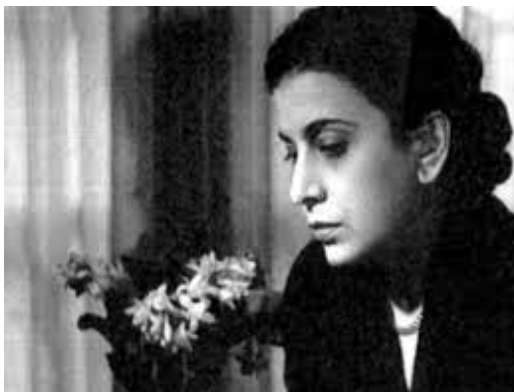
Ilustración 1. Luz Machado Arnao.

Este escrito se le atribuye a la poeta guayanesa, ensayista y diplomática venezolana Luz Machado Aguilera, defensora de los derechos de la mujer, cofundadora de la Asociación Venezolana de Escritores y de la Sociedad Bolivariana de Venezuela. Mercedora en 1946 del Premio Municipal de Poesía por su obra “Vaso de resplandor” y, posteriormente, fue reconocida con el Premio Nacional de Literatura en 1987. Muchos de sus escritos fueron publicados en los diarios La República , El Nacional , El Universal , El Impulso , La Razón , El Mundo , Fantoches , Ahora y en las revistas Alondra , Valores Intelectuales , Contrapunto (1946-1950), Elite , Shell , Kena , Revista Nacional de Cultura , Lírica Hispana e Imagen .