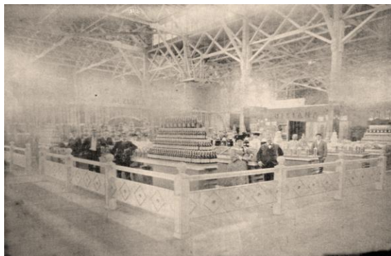
Figura 1. Vista de la exhibición de bebidas venezolanas en 1904.

atención que el Director del Gran Museo Comercial de Filadelfia solicitó tener ese valioso muestrario, que le fue donado luego por Castro junto con otros objetos venezolanos. 38