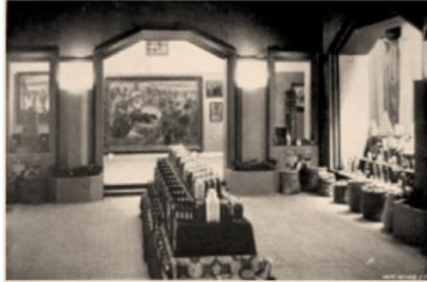
Figura 4. Vista interior de una de las salas de exhibición de Venezuela en Lieja, 1930.