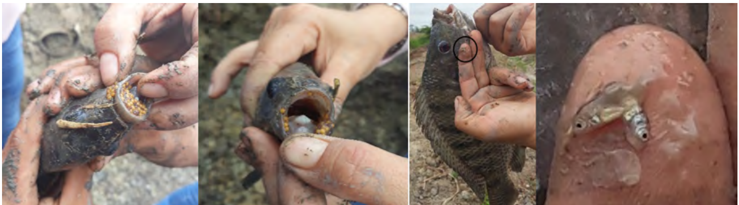
FIGURA 7. Tilapia con presencia de huevos y larvas en la boca

** : peces con huevos y larvas en la boca, * : peces con larvas en la boca