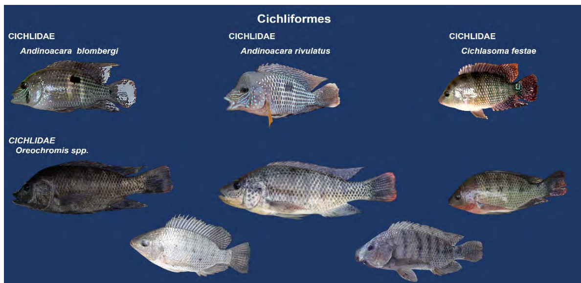
FIGURA 3. Familias y especies del orden Cichlidae capturadas en el río Churute, Ecuador