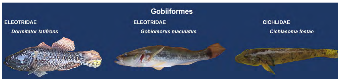
FIGURA 4. Familias y especies del orden Gobiiformes capturadas en el río Churute, Ecuador