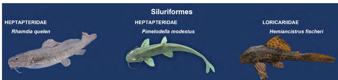
FIGURA 5. Familias y especies del orden Siluriformes capturadas en el río Churute, Ecuador