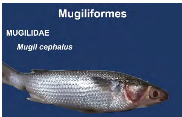
FIGURA 6. Familia y especie del orden Mugiliformes capturadas en el río Churute, Ecuador