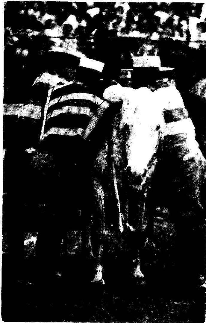
Huasos. Día de rodeo Col. Pedro Ortíz