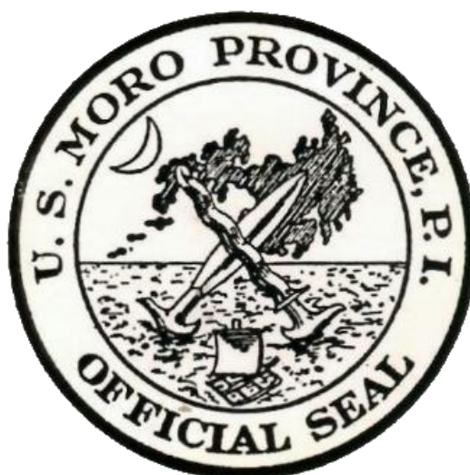
Imagen 2: Sello oficial de la Provincia Mora (1903-1914)