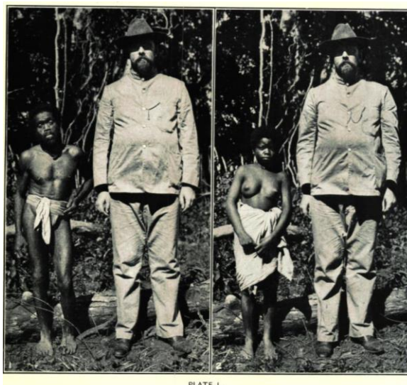
Imagen 1: Fotografía reproducida en Dean C. Worcester, "The Non-Christian Tribes of Northern Luzon", The Philippine Journal of Science , Vol.1 No. 8 (octubre), 1906. P. 876.