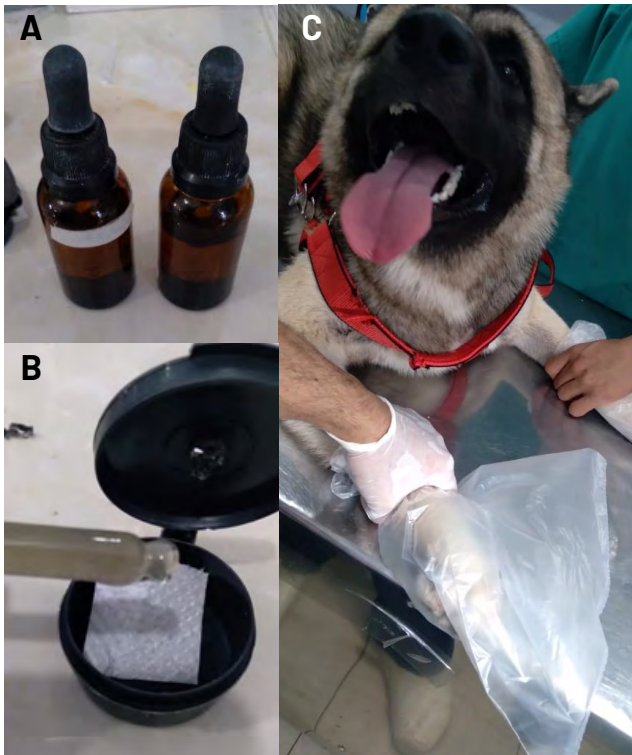
FIGURA 1. Protocolo tipo bolsa, para colocar en contacto el CDS (gas) y la lesión micótica del perro. A.- Reactivos utilizados (clorito de sodio al 25 % y ácido cítrico al 50 %); B.- Envase plástico para desarrollo de la reacción química; C.- Paciente con la bolsa que le cubre el área de la lesión dérmica

El procedimiento consistió en colocar dos gotas de cada reactivo; NaClO 2 al 25 % y ácido cítrico al 50 %, dentro de un pequeño envase plástico, a objetode prevenir el contacto de la mezcla con la piel. En el recipiente, previamente agujereado, ocurrió la reacción química que liberó el gas, este fue introducido en la bolsa y al salir por los agujeros, inundó el interior de la funda. Se cerró cualquier salida de aire, y se esperó 5 minutos (min), el procedimiento fue repetido por 5 d seguidos (FIG. 1).