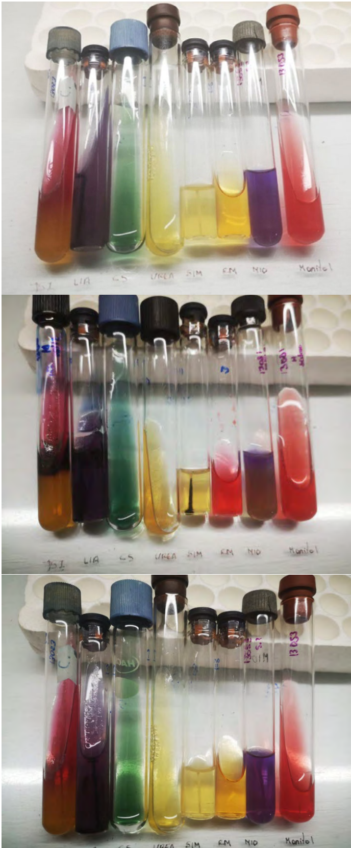
FIGURA 3. Resultados medios de cultivos, utilizados para la identificación bioquímica diferencial para Salmonella pullorum y Salmonella gallinarum