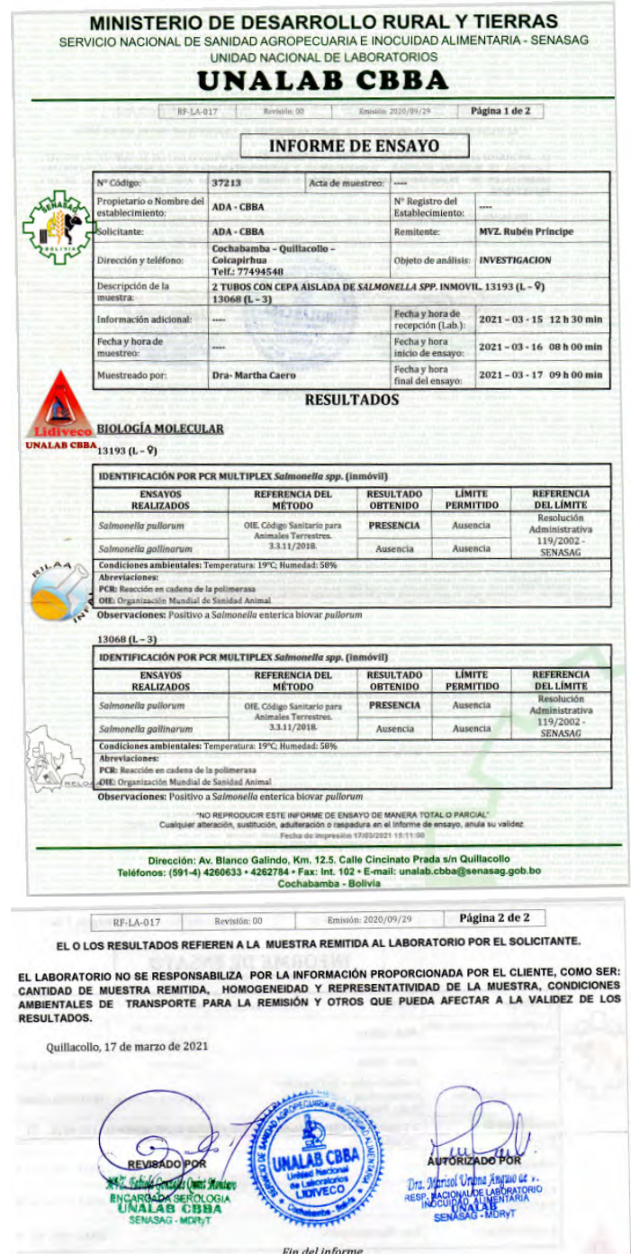
FIGURA 4. Ensayo de biología molecular para Salmonella pullorum . Informe Oficial del Ministerio de Desarrollo Rural y Tierras, Servicio Nacional de Sanidad Agropecuaria e Inocuidad Alimentaria-SENASAG, Unidad Nacional de Laboratorios, UNALAB CBBA. Cochabamba, Bolivia