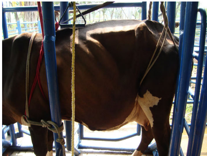
FIGURA 3. Vaca sujeta con sogas en el brete para contención de tronco