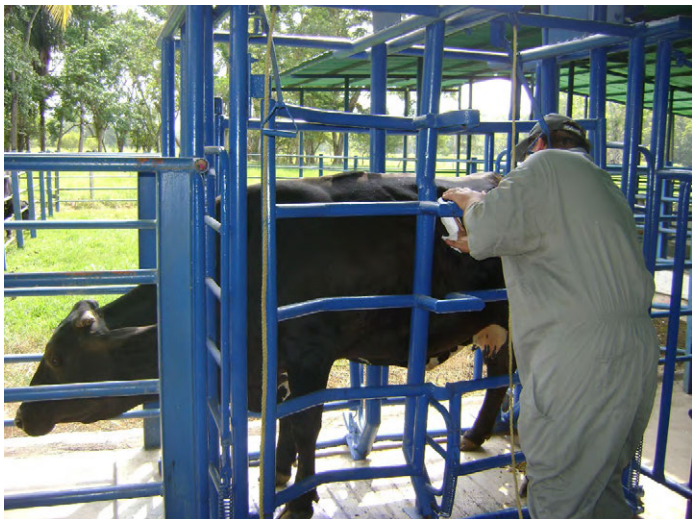
FIGURA 1. Brete para contención del tronco