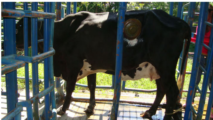
FIGURA 2. Brete para contención de tronco con la puerta lateral abierta

fuese capaz de mantenerse en una posición fisiológica normal que le permitiera respirar y eructar sin peligros de asfixia o de aspiración de fluidos ruminales. Los animales fueron sujetos en el brete y luego fueron colocadas sogas cruzadas a la altura del pecho, seguidamente dos lazadas fueron pasadas a través de las caras internas de los muslos para sujetar la cadera y evitar que el animal asumiera una posición de decúbito (FIG. 3).