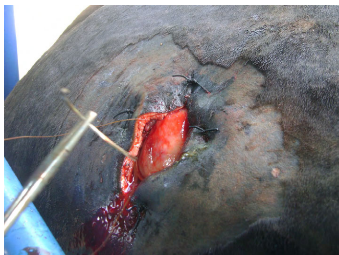
FIGURA 5. Patrón de sutura continua entre la piel y el rumen, para unirlos y permitir la ruminotomía sin riesgos de peritonitis