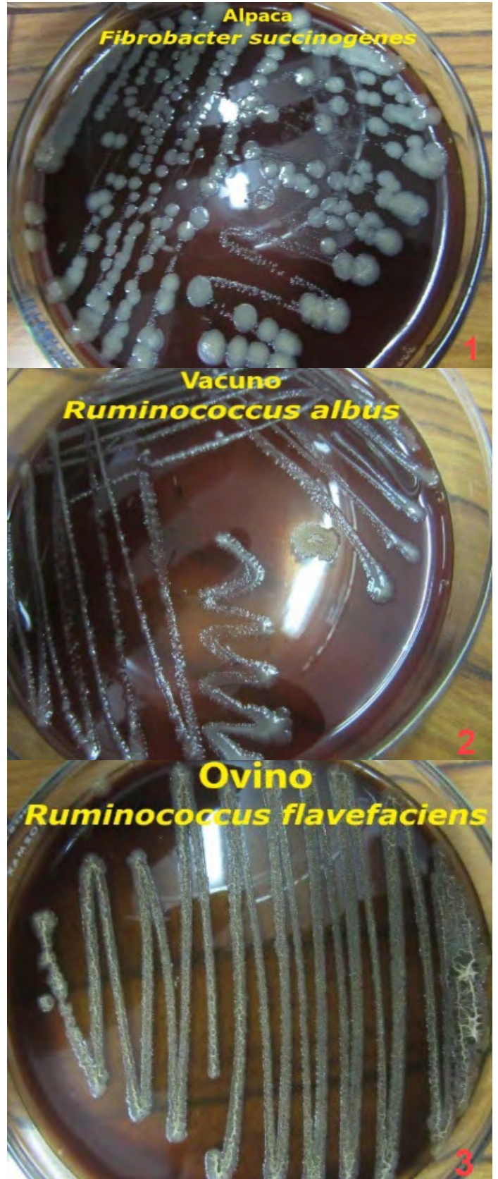
FIGURA 1. Bacterias aisladas de tres líquidos ruminales: alpaca (1), vacuno (2) y ovino (3), en medio BHI

Las cepas de F. succinogenes provenientes de muestras de alpaca y ovino presentaron alta capacidad degradativa celulolíticas (70,8 y 50,0 %) y F. succinogenes elongata en vacuno y alpaca (50,0 y 43,8 %), igualmente se encontró alta capacidad degradativa en R. flavefaciens provenientes de alpaca y ovino (62,2 y 50,0 %) y R. albus provenientes de alpaca (66,7 %) siendo inferiores en cepas de otras especies de estudio (TABLAS III y IV; FIG. 2).