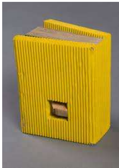
Obra "Daily Mirror" de Dieter Roth 1970.

las creaciones en busca de otros formatos. Duchamp, configura la idea de utilizar el soporte libro como transmisor y vehículo de imágenes y textos, clave para entender la aparición de los libros de artista. Recordemos su concepción multidisciplinar de la obra de arte, los ready-made, (objetos ya realizados encontrados, que por ser elegidos por el artista se convierten en arte), los ensamblajes, los montajes ambientales y sus cajas....Su libro Malheureux (1919) contenía las instrucciones para ser expuesto a las inclemencias del tiempo y así transformarse, indicando el camino a los libros intervenidos por los artistas. A bruit secret (1916), ovillo de cuerda entre chapas de latón, es precursor del libro escultura...La utilización de cajas como alternativa al libro encuadernado es, también, referencia fundamental para el futuro LA. Caja (1914), contiene notas manuscritas y dibujos; Caja verde (1934) y Boîte-en valise (1935-1941), son obras clarificadoras de este concepto..." (Consultado el 15-02-2022 y disponible en https://www.makma.net/breve-historia-de-los-libros-de-artista/ ).