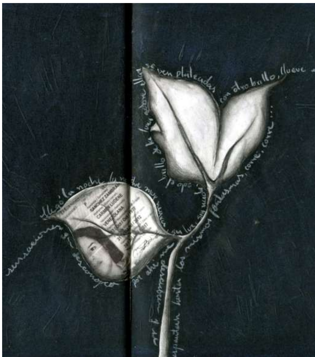
Detalle de Libro de artista "Flores de Lolita" (2020) de Carmen Ludene. Medidas: 22,5 x 14 x 2 cm (Cuaderno). Obra dedicada a la gran escritora tachirenses Lolita Robles de Mora a manera de tributo.

oscuro podía ser intimidante o algo extrañamente juguetón, y ni hablar de lo que pensaban los participantes al tocar o rozar con las yemas de los dedos la composición de elementos incógnitos utilizados dentro de la parte secreta e interna de la pieza.