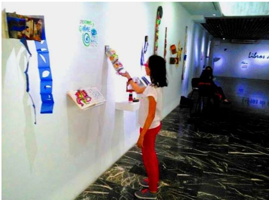
Muestra en UNEARTE (Caracas), 2017 denominada "Arte en proceso".