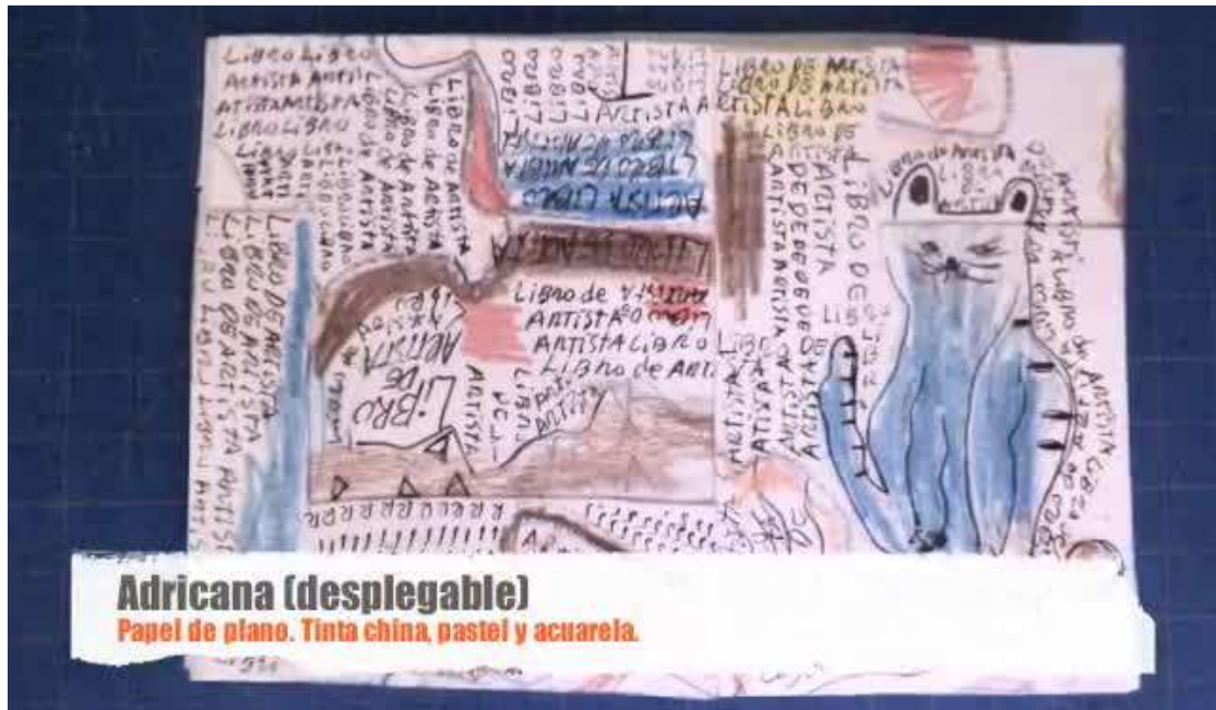
“Adricana”. Desplegable. Papel de plano. Tinta china y acuarela. Carlos Yusti. 2018.

La revista de artes visuales y cultura contemporánea MAKMA, nos aporta datos sobre las maneras de experimentación e invención de los artistas a partir de formatos innovadores, diversos, y muy particulares registrados por la historia: