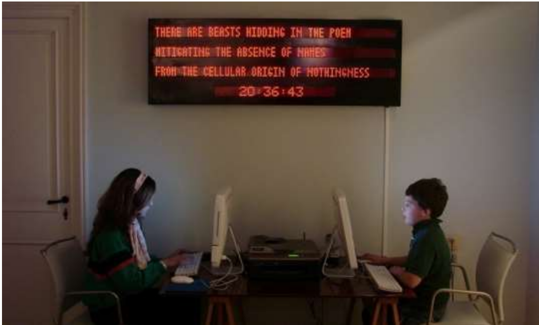
Obra "Reloj poético" de Yucef Merhi.

Yucef Merhi es un poeta, artista y hacker venezolano que ha producido importantes obras usando equipos tecnológicos diversos o multimedia también y otros dispositivos en la presentación de sus palabras escritas. Merhi creó, diseñó y programó por ejemplo el "Reloj Poético" (Caracas, 1997), el cual es una máquina que convierte el tiempo en poesía produciendo diariamente 86.400 poemas distintos, porque muta cada minuto, cada hora.