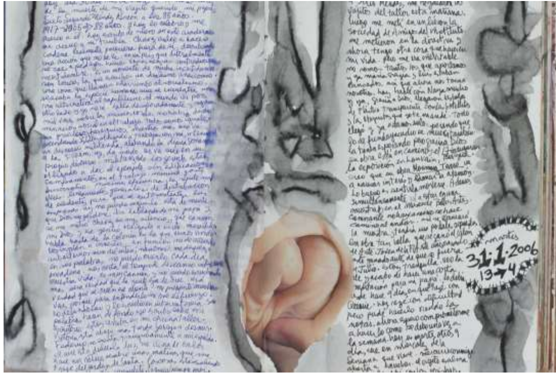
Detalle de libro de artista de Consuelo Méndez. (Backroom, Caracas, 2014).

Sobre hacer aportaciones muy particulares y biográficas de alto contenido compositivo y estéticos en trabajos tipo libro, la gran artista venezolana Consuelo Méndez posee unos libros de artista muy orgánicos, entre el manejo del digamos por ejemplo “diario” o “cuaderno de anotaciones” donde conjuga vivencias, memoria, anécdotas, etc., presentándose desde el dibujo, la pintura, la poesía y la mixtura de todo lo que funde como confluencia sublime.