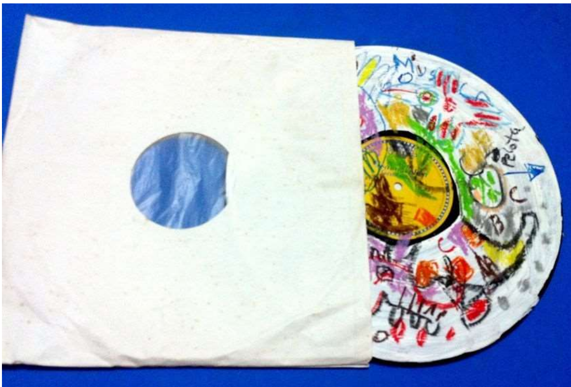
Detalle de obra de Carlos Yusti.

El libro que prácticamente nos muestra la multiplicidad de presentarnos por millones lo poético, es el famoso trabajo denominado “Cien mil millones de poemas” de Raymond Queneau, como veremos: