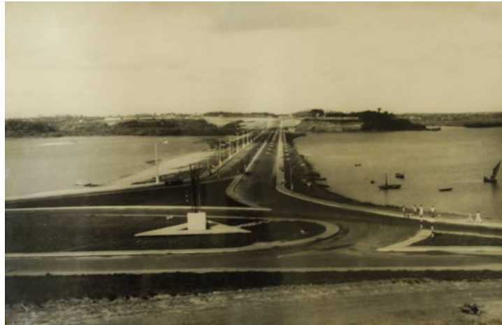
Figura 3 Barragem do Bacanga - São Luís (MA)