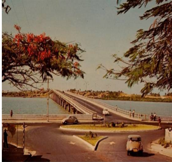
Figura 2 Ponte do São Francisco - São Luís (MA)