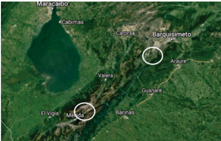
Figura 1. Mapa del Occidente de Venezuela. Obsérvese la ubicación geográfica y distancia territorial que incluye a las poblaciones pretéritas del Estado Lara y Mérida.

Se seleccionaron 08 mandíbulas integrales procedentes de la Colección de Paleodemográfica, constituida por restos óseos de la población del yacimiento del Valle de Quíbor (Edo. Lara) (ver figura 1), y se encuentra ubicada cronológicamente en el período Prehispánico (Siglos II y IV d. C.).