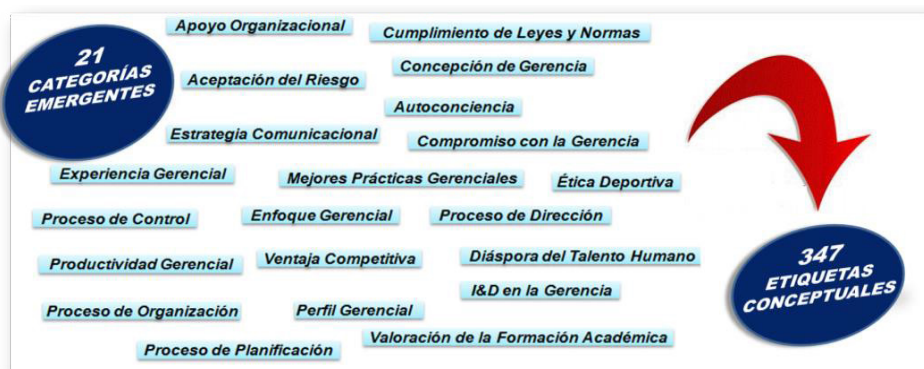
Gráfico 1. Categorías emergentes y total de etiquetas conceptuales.

Para el procesamiento y análisis de los datos que dieron respuestas a las interrogantes planteadas, se establecieron unidades hermenéuticas en cada nivel jerárquico y stakeholders, donde surgieron un total de 347 etiquetas conceptuales en el proceso de codificación abierta, que fueron agrupadas en 21 categorías emergentes (ver gráfico 1). Seguidamente se seleccionaron aquellas categorías que resultaron dominantes, para analizar el tipo de relación que tenían bajo codificación axial, análisis que produjo 104 etiquetas conceptuales que correspondieron a seis categorías dominantes en una primera aproximación.