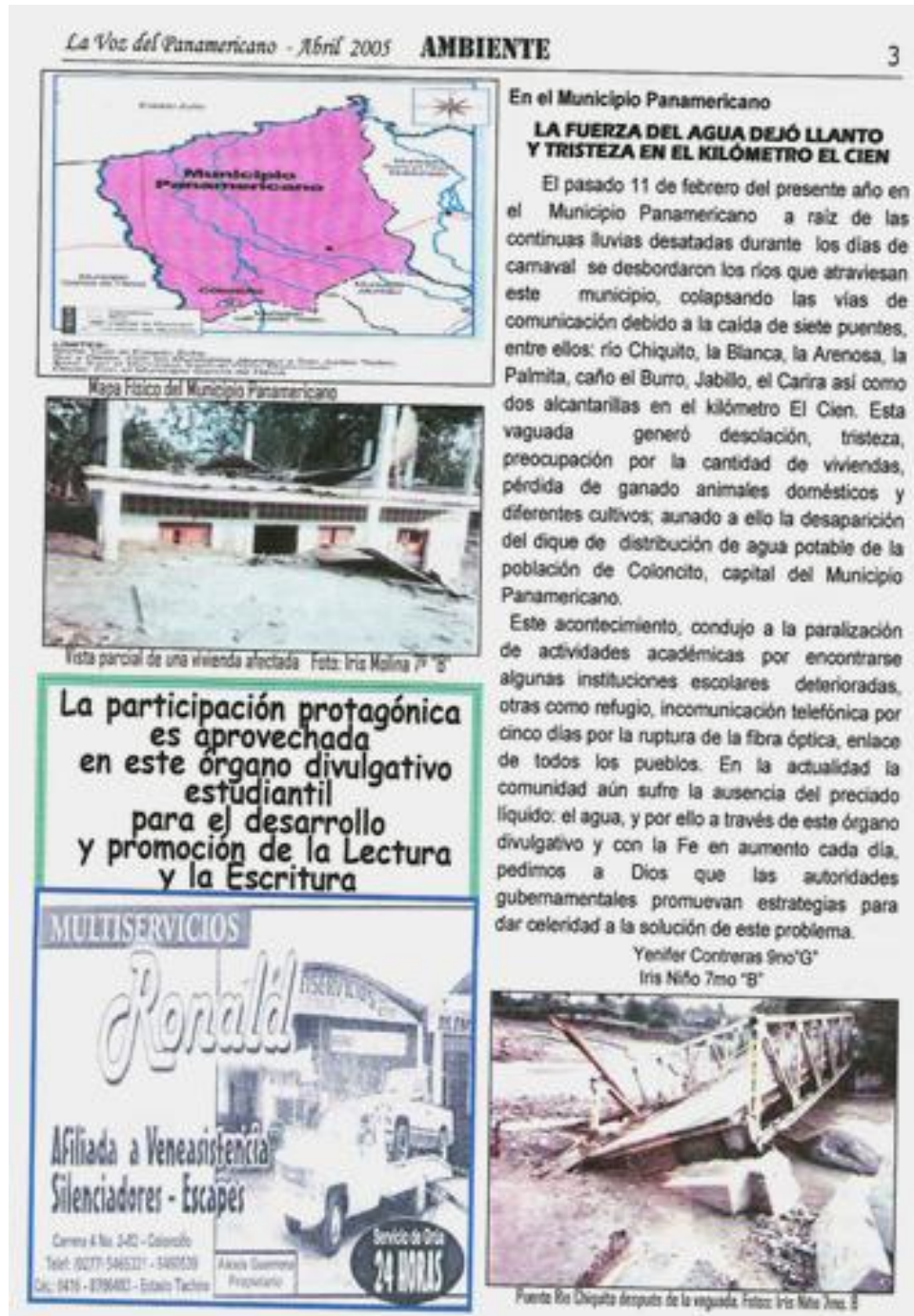
Imagen 7. Diseño de la tercera página editada