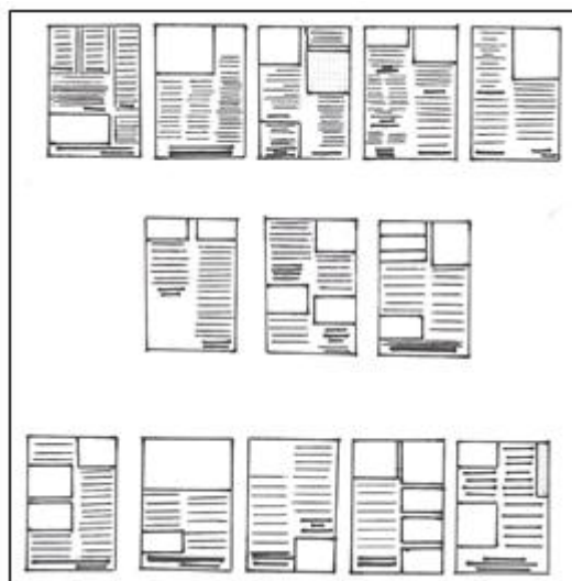
Imagen 3. Muestra del diseño de la diagramación de las páginas interiores del periódico escolar en manuscrito