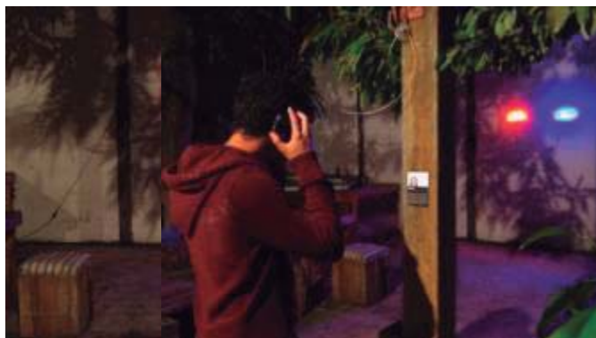
(Figura 2) El que no oye no siente. Instalación luz y sonido, Materiales: luces de policía, audifonos. Medidas variables (Peñaranda, 2013)

Elsy Zavarce / Lourdes Peñaranda / Luis Gómez