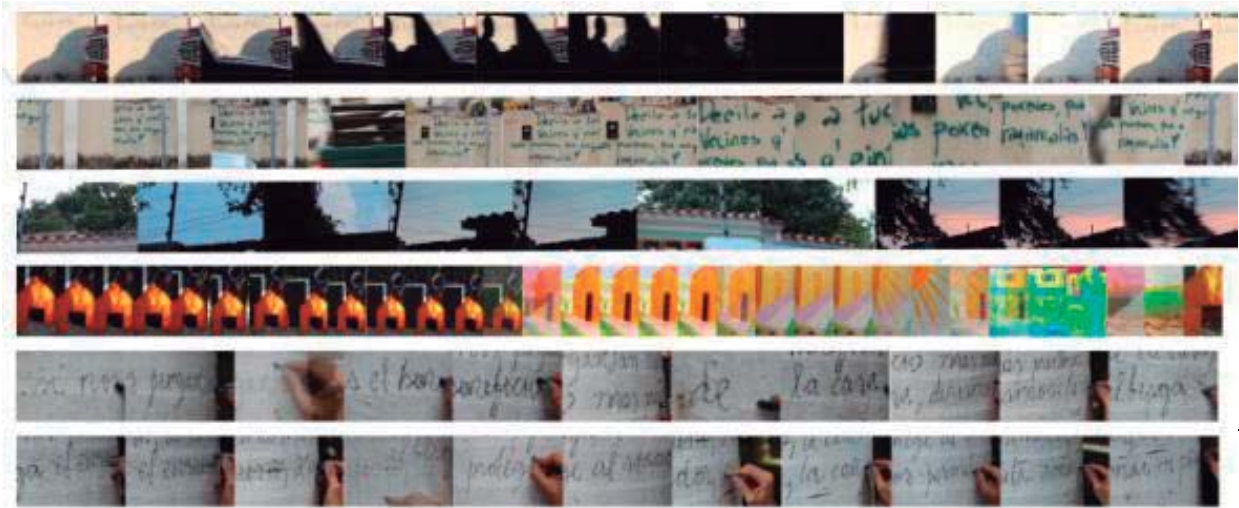
Figura 6. Proyecto Furia incidentes 2012: Artista: Elsy Zavarce, 2012 Titulo: Dilatación de tiempos. Video instalación La obra consiste en una serie de pantallas de videos, dibujos y textos. Algunos videos son grabados a través de las cámaras de seguridad de la casa, otros textos transcritos y dibujos de la infancia. La instalación se realiza en una disposición en pared de aprox de 1.80 por 1.80.

Elsy Zavarce / Lourdes Peñaranda / Luis Gómez