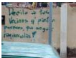
Fotograma video de Contexto desde la casa.