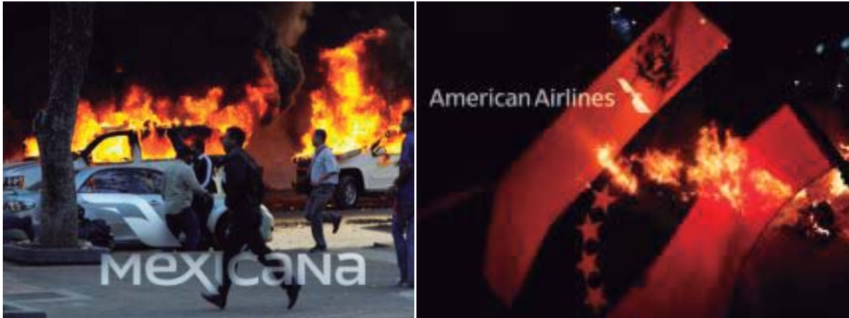
Figura 1 Serie: Indiferencia capitalista al vuelo. Fotografía digital sobre metacrilato. Medidas: 80 x 53 cm c/u. (Peñaranda, 2014)

Elsy Zavarce / Lourdes Peñaranda / Luis Gómez