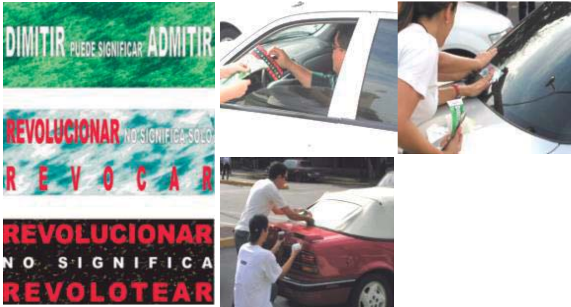
Figura 3. SOBRE-REVOLUCIÓN. Materiales: 2000 calcomanías para vehículos. Medidas: 21 x 7 cms. c/u.

Elsy Zavarce / Lourdes Peñaranda / Luis Gómez