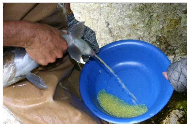
Fotografía 3. Ovas de ejemplar hembra de trucha arcoíris, extracción manual.