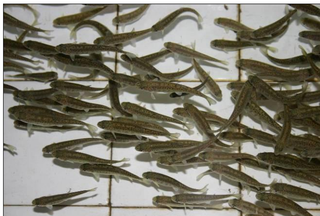
Fotografía 1. Alevines de trucha arcoíris de 2 meses en piletas en CETLM.