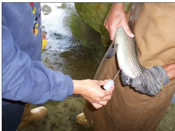
Fotografía 2. Obtención de semen de ejemplar de trucha arcoíris, mediante extracción manual.