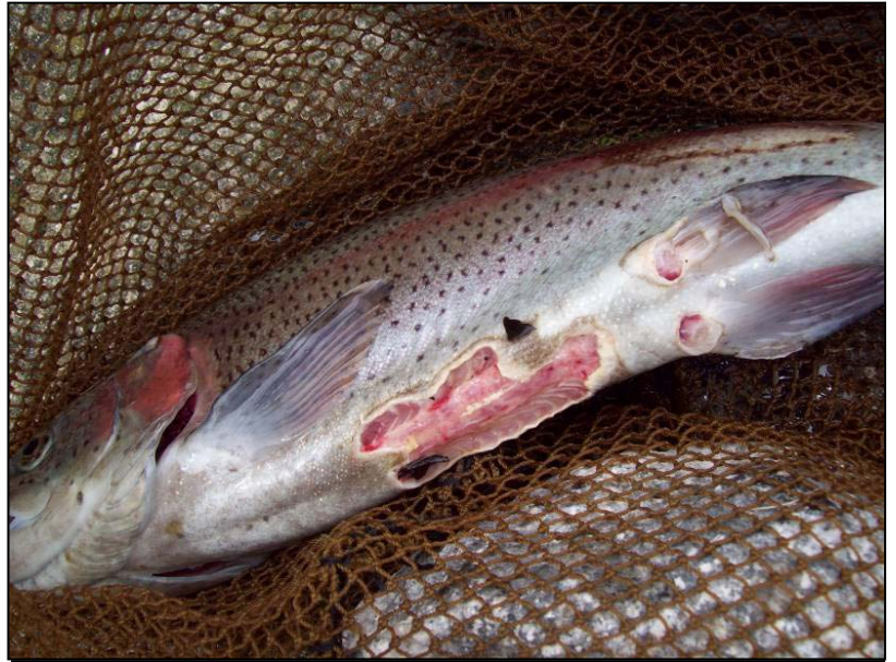
Foto 1. Ulcera ventral en el tegumento de trucha ( Oncorhynchus mykiss ).

Los reproductores se revisaban semanalmente después en los tratamientos, y se registraron las zonas y número de lesiones por ejemplar observadas a simple vista. Los cadáveres de las truchas se retiraban al ser identificados en las observaciones diarias. Se realizaba limpieza de los tanques semanalmente, para retirar crecimiento de algas de las superficies del piso y las paredes.