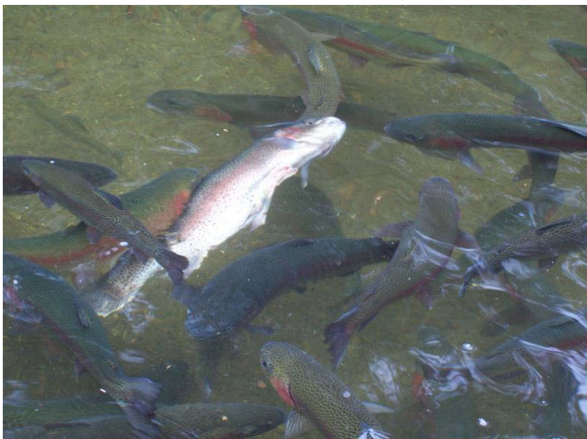
Foto 2. Truchas arco iris ( Oncorhynchus mykiss ) ulcerada con evidentes problemas de estabilidad del movimiento en los estanques.

Como sabemos de trabajos anteriores en esta revista (5), la mayor cantidad de truchas ulceradas por manipulación fueron machos, lo que sugiere la susceptibilidad de estos a otras ulceraciones. Aunque lo anterior nos señala que deberían existir factores que confieren una mayor resistencia al tegumento de las truchas hembras frente a la abrasión generada por manipulación con guantes, en la ulcera ventral, no es así, debido a que apareció con cierta tendencia específica en las truchas hembras, tal vez debido a diversos factores como los histológicos, la queratinización de epitelio, y la morfología corporal, también es de asumir las infecciones secundarias, que participan en las lesiones, pero que por sí solas no las causan, a diferencia de las furunculosis y otros tipos de patologías tegumentarias de transmisión horizontal y vertical no tratadas aquí.