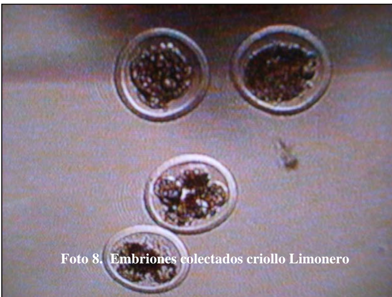
Foto 8. Embriones colectados criollo Limonero