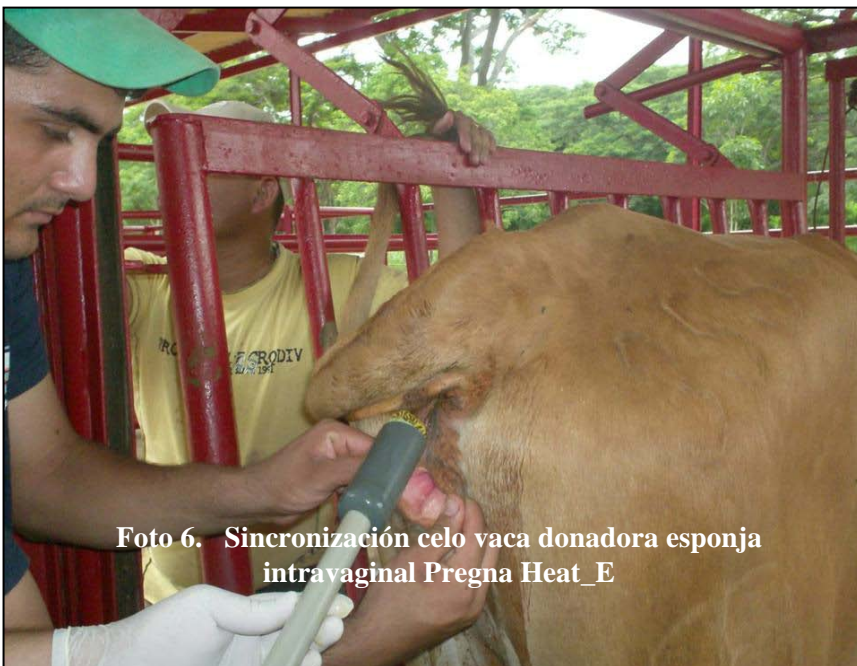
Foto 6. Sincronización celo vaca donadora esponja intravaginal Pregna Heat_E

Letras diferentes en la misma fila indican diferencias significativas.