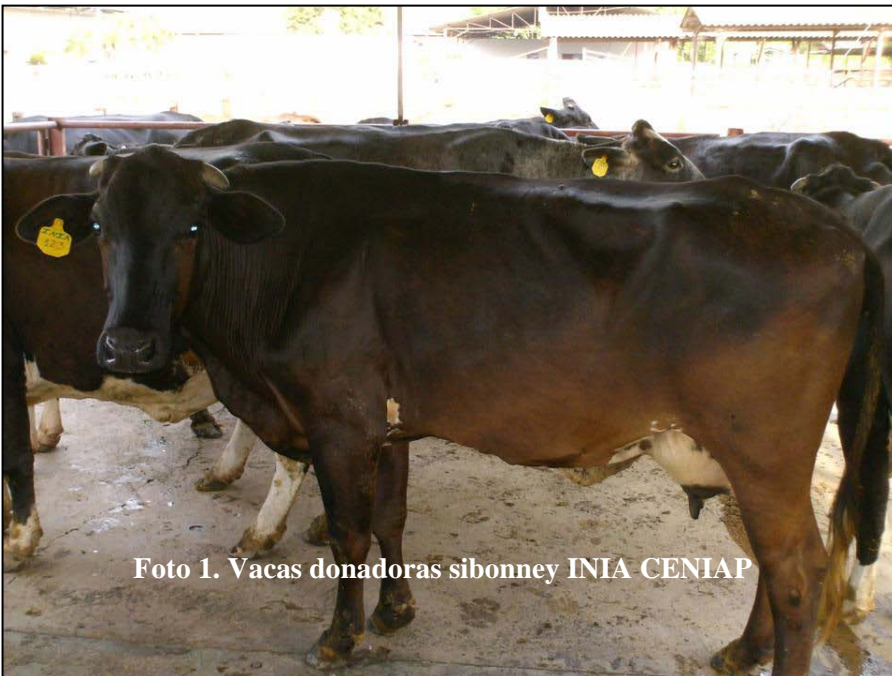
Foto 1. Vacas donadoras siboney INIA CENIAP

Limonero y Siboney entre otras, que aún existen en tres rebaños del INIA Venezuela, lo que se traduciría en aumento de la producción y productividad ganadera nacional, disminución de la importación de productos y subproductos de este rubro, así como la disminución del costo de producción de este tipo de ganado doble propósito con alta calidad genética.