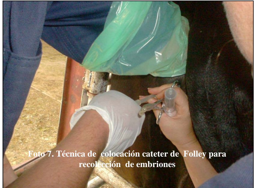
Foto 7. Técnica de colocación cateter de Folley para recolección de embriones

Considerando que el número de embriones transferibles y congelables son indicadores de la calidad de los embriones obtenidos, al comparar el número total de embriones transferibles vs congelables, del total de embriones transferibles (163), el 95,1% fueron congelables (155), mostrando la raza CrL un menor porcentaje de embriones congelables (94,6%) en comparación con la Sib (95,5%). González et al. (1997), observaron en vacas CrL, un número de embriones transferibles similar (60,5%) a lo obtenido en vacas Sib en este estudio. González et al. , (1997), obtuvieron con vacas Criollo Limonero, un menor porcentaje de embriones congelables (87%) a lo obtenido en el estudio para CrL y Sib. El promedio de embriones transferibles/vaca lavada, muestra una tendencia a ser mayor en vacas Sib ( 4,5 \pm 1,0 ) que en vacas CrL ( 2,2 \pm 0,4 ; p > 0,05 ), al igual que el promedio de embriones congelables/vaca lavada (Sib= 4,3 \pm 0,8 ; CrL= 2,1 \pm 0,4 ; p > 0,05 ). En general, el