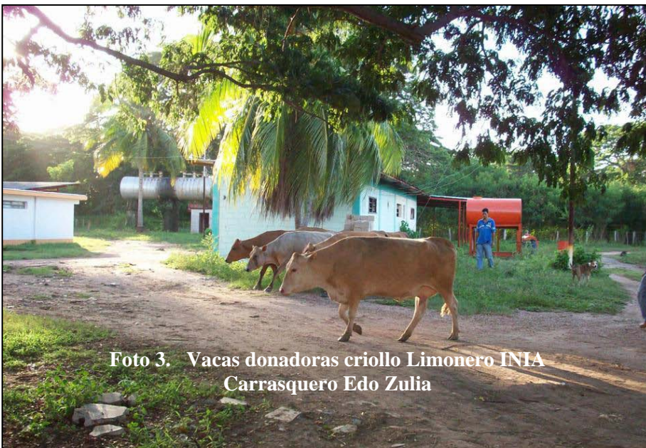
Foto 3. Vacas donadoras criollo Limonero INIA Carrasquero Edo Zulia

capturando los embriones en filtros de 75 micrones de