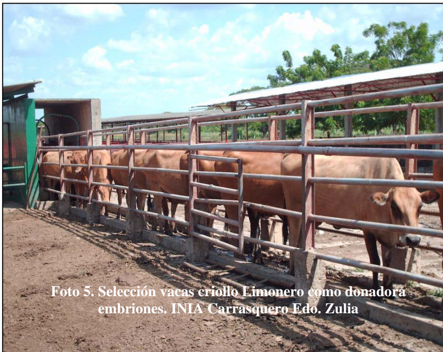
Foto 5. Selección vacas criollo Limonero como donadora embriones. INIA Carrasquero Edo. Zulia

realizó Prueba de T de student para muestras independientes.