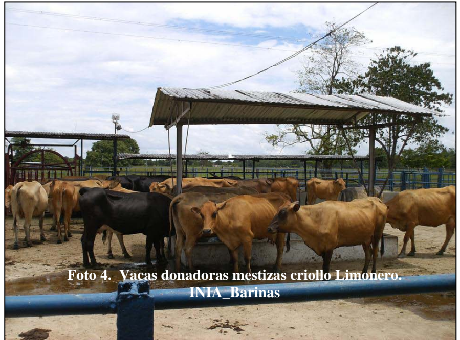
Foto 4. Vacas donadoras mestizas criollo Limonero. INIA Barinas

Los análisis estadísticos fueron realizados usando el programa InfoStat®, 2002, en base al: número de embriones transferibles (NET; grado 1 y 2), número de embriones congelables (NEC; grado 1). Número total de estructuras colectadas (NTEC; grado 1, grado 2, grado 3 y grado 4). Las frecuencias de las respuestas al tratamiento de superovulación entre razas fueron analizadas con la prueba de ji cuadrado ( \chi^2 ).