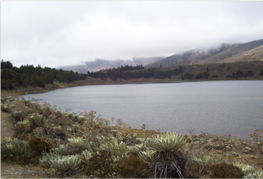
Laguna “La Grande” / Laguna de Mucubají

Valles grandes: esos son los valles más grandes, por aquí mismo en apartaderos estamos en un valle, cuando uste’ se para en las orillas de Llano del Hato y mira pa’ acá se da cuenta que esto está metido entre las montañas y que hay mucho espacio entre montaña y montaña, y en el fondo donde terminan esas montañas en el espacio que dejan entre ellas, está Apartaderos.