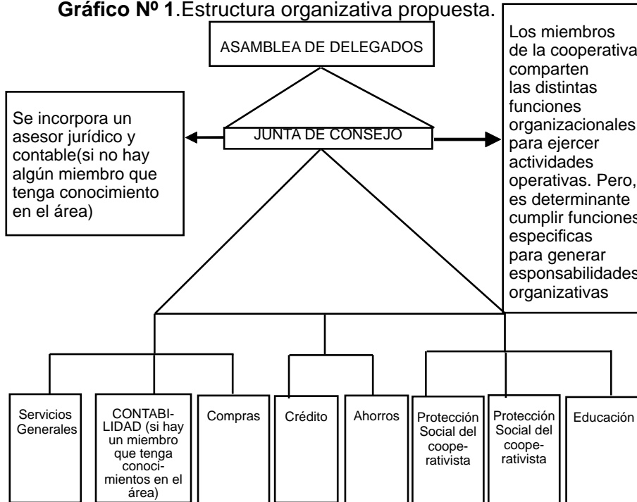
Gráfico Nº 1. Estructura organizativa propuesta.