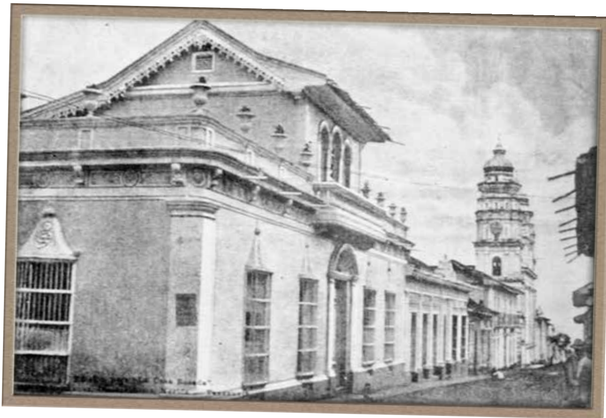
Av. Bolívar, Mérida