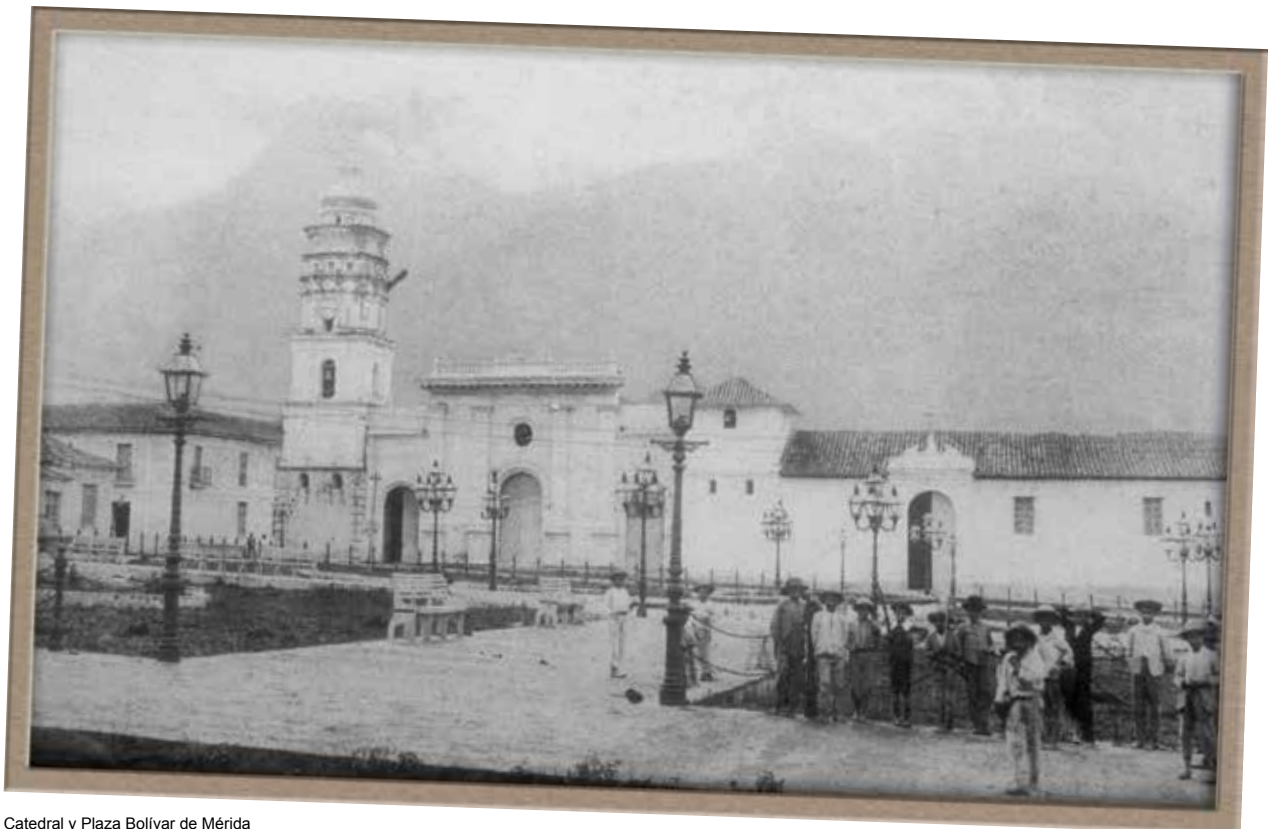
Catedral y Plaza Bolívar de Mérida

Son, entonces, la vida trashumante y la voz crítica, dos de los elementos fundantes de su emblemática figura, a las que intentamos aproximarnos. Su permanente transitar por los caminos del país y del mundo lo alejaron durante largos períodos de la ciudad que amaba, pero esto no implicó negación e infortunio en su vida, ya que siempre regresó para entenderse de sus asuntos personales, así como para estrechar los lazos con sus familiares y amigos, a pesar de las inmensas dificultades que tales recorridos implicaban en un país desconectado (por la inexistencia de una red de carreteras), infectado de plagas y de guerrillas, hundido en el atraso y en las contiendas políticas. Sin duda, el constante viajar a disímiles destinos marcó de manera profunda su prosa y amplió su visión crítica, lo que se patentizó en la hondura de su obra y su permanente hilvanar teórico en torno a la obra literaria de los otros. Sin obviar, por diáfana, su amplia cultura rayana