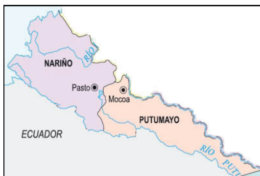
Figura 1: área Nariño-Putumayo

La ruta utilizada actualmente por el comercio internacional ingresa por Cúcuta y sale al Ecuador por el Puente Internacional Rumichaca en el Departamento de Nariño. De acuerdo con estimaciones del Ministerio de Transporte, la nueva ruta proyectada será más larga que la original en 174 km. Sin embargo, sin tramos en terreno escarpado, cerca del 53% de su trazado se encuentra en terreno plano y el 14% en terreno montañoso. Estas cifras contrastan con los datos del corredor original, en el cual sólo el 27.5% es por terreno plano, el 44% por terreno montañoso (casi un 30% más que en el proyecto) y cerca del 10% se encuentra en terreno escarpado. El nuevo corredor representará ahorros en energía para sus principales beneficiarios: los vehículos pesados. Estos obtendrán ahorros de $203 mil en un recorrido entre Venezuela y Ecuador y 12 horas y 15 minutos menos para realizar un recorrido. La supervía para tres países, que une a Quito, Bogotá, Caracas pasando por Mocoa, San Miguel y Lago Agrio que hace parte de compromisos internacionales suscritos entre Colombia, Ecuador y Venezuela está avanzada en el Ecuador donde se han construido y pavimentado con especificaciones de vía rápida 286 kilómetros. Urge que Colombia culmine la pavimentación de la carretera entre Mocoa y el Puente Internacional de San Miguel.