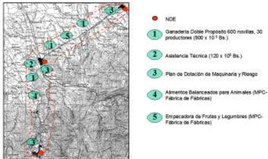
Figura 5. Núcleo de Desarrollo Endógeno La Fría - Colón - Coloncito