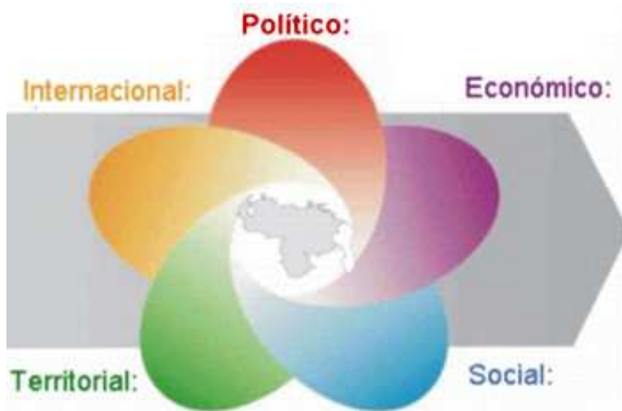
Figura 1. Los cinco equilibrios de las Líneas Generales del Plan de la Nación 2001-2007

En concordancia con su ideario político, la administración Chávez presenta en septiembre de 2001, el Plan de Desarrollo Económico y Social de la Nación 2001-2007 dentro del cual se esboza el modelo venezolano a edificar para abordar el desarrollo, tal como lo delineara en su propuesta de gobierno en 1998. Este plan diseña un modelo de política social plenamente opuesto al Plan de Desarrollo neoliberal presentado en el segundo mandato de Rafael Caldera y denominado "Agenda Venezuela". El Plan 2001-2007 expone el fomento de la eco-