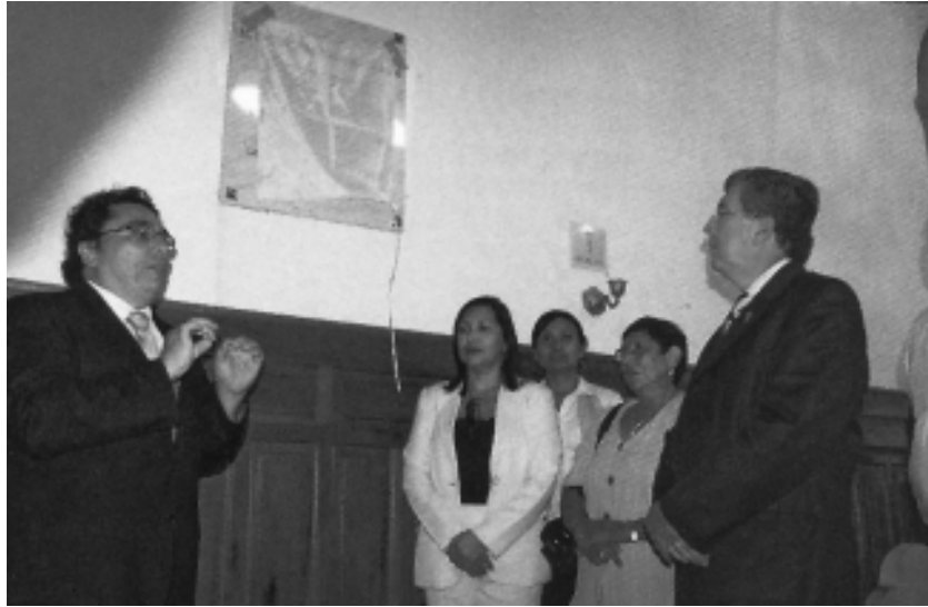
Acto realizado el 12 de septiembre de 2010