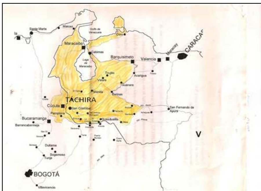
Mapa 1. Espacio geohistórico que comprendía la Diócesis de Mérida de Maracaibo (1778). Igualmente puede observarse la REGIÓN TACHIRENSE, donde se encuentran las ciudades de San Cristóbal, La Grita, San Antonio, Cúcuta y Pamplona.

tachireNSE, conocida así a partir de 1856 como acotamos, tuvo su manifestación en tres importantes Actas de Adhesión que expresaban el consenso del pueblo llano. Fue la primera vez que se constata la presencia de una conciencia nacional con referencia a Caracas y no a la Nueva Granada. De manera que estas actas son fundamentales en la construcción de la nación venezolana.