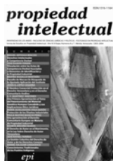
Tabla de Contenido propiedad intelectual

Mérida. Venezuela. Año IV. Nos 6 y 7. Diciembre 2004. ISSN:1316-1164