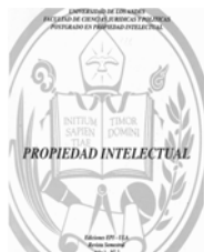
Tabla de Contenido propiedad intelectual

Mérida. Venezuela. Año III. N° 3. Mayo 1998.