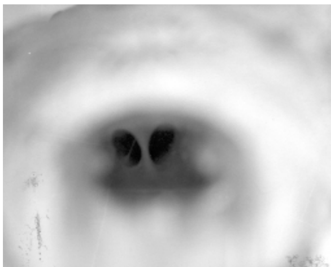
FIGURA 1. ASPECTO MACROSCÓPICO DE UN SEPTUM VAGINAL TRANSVERSO EN UNA CERDA.

cerdas, no es posible descartar la existencia de anomalías asociadas al septum vaginal en otros sistemas corporales.