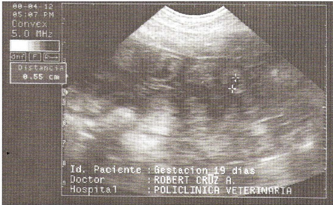
FIGURA 1. IMAGEN ULTRASONOGRÁFICA DE UNA GESTACIÓN DE 19 d. OBSERVE UNA DE LAS VESÍCULAS EMBRIONARIAS DE 0.77 cm DE DIÁMETRO.