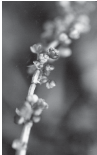
Figura 1. Rumex acetosella L. en flor.