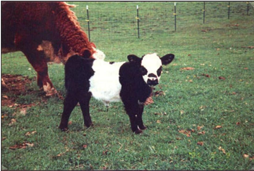
Figura 4. BOVINO MINIATURA RAZA PANDA

- http://www.minicattle.com , consultada el 05-04-2007