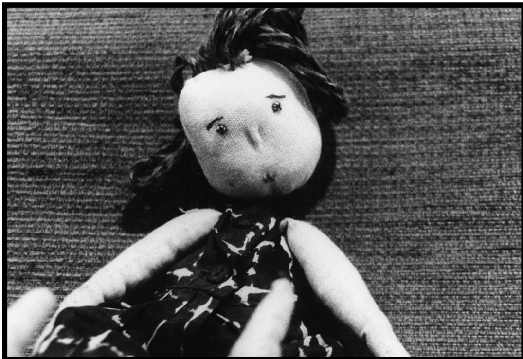
Autor: Alín Koteich Khatib / Victoria 2006 / Analógica Canon AE1 / Película B/N 400 asa