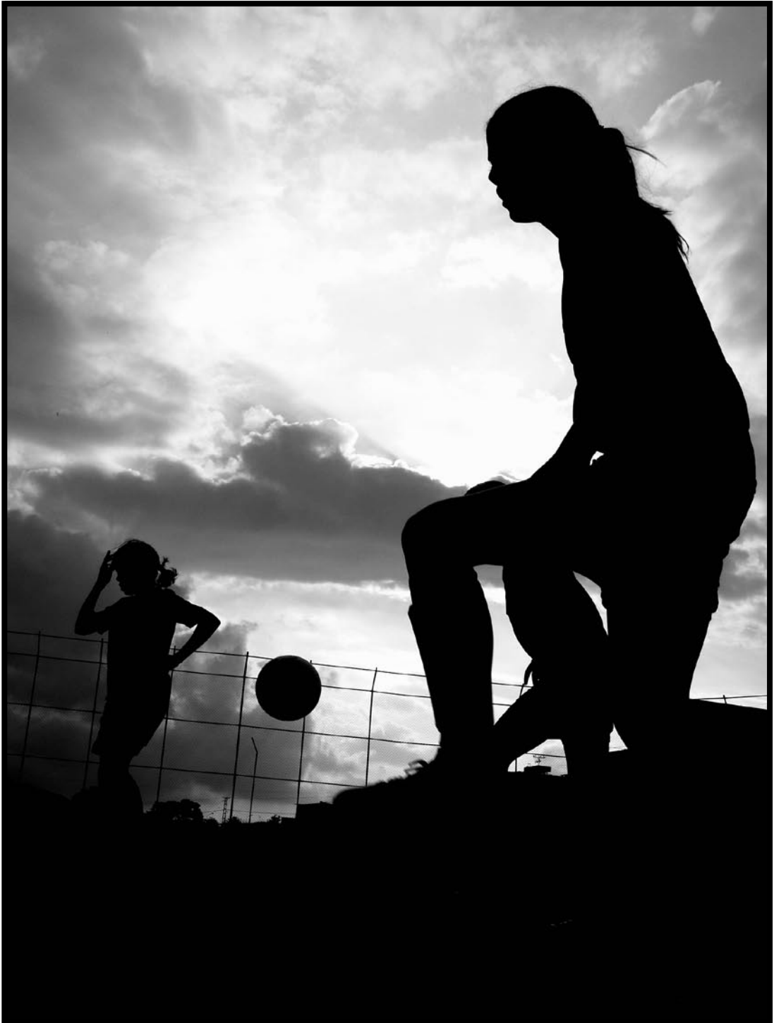
Autor: Patricia Páez / Contra Luz Febrero 2006 / Sony CyberShot