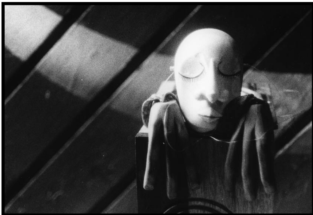
Autor: Alín Koteich Khatib / Despertar 2006 / Analógica Canon AE1 / Película B/N 400 asa