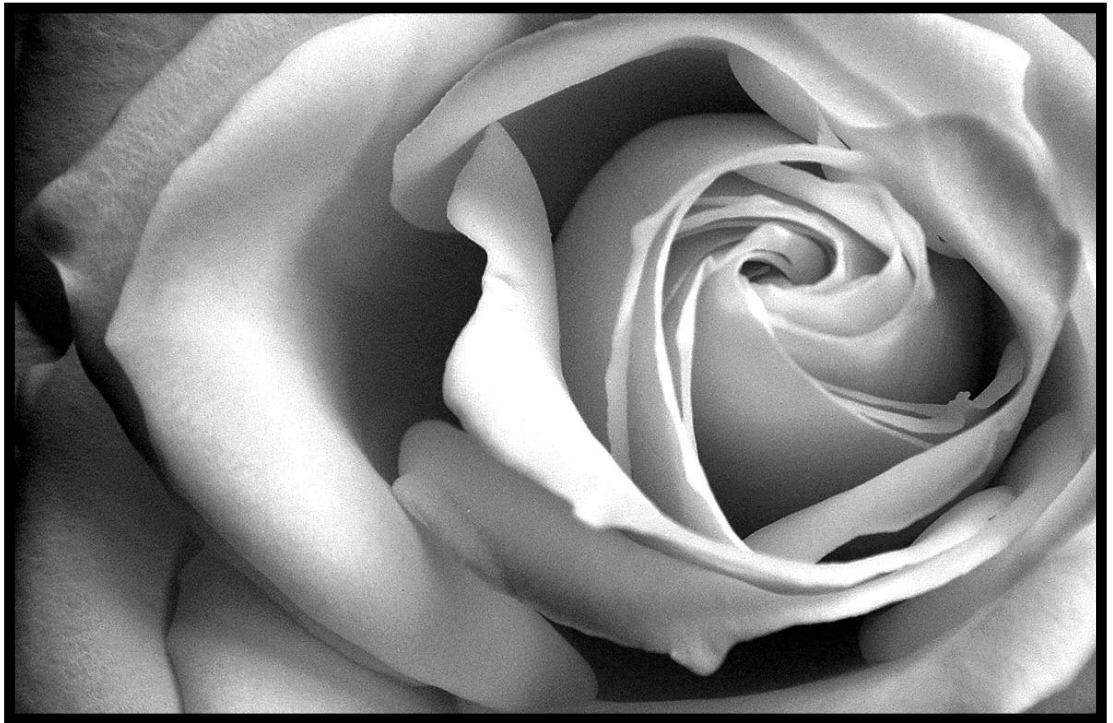
Autor: Salomé Fuenmayor / Rosa 2005 / Fujifilm Finepix 3200 / Digital