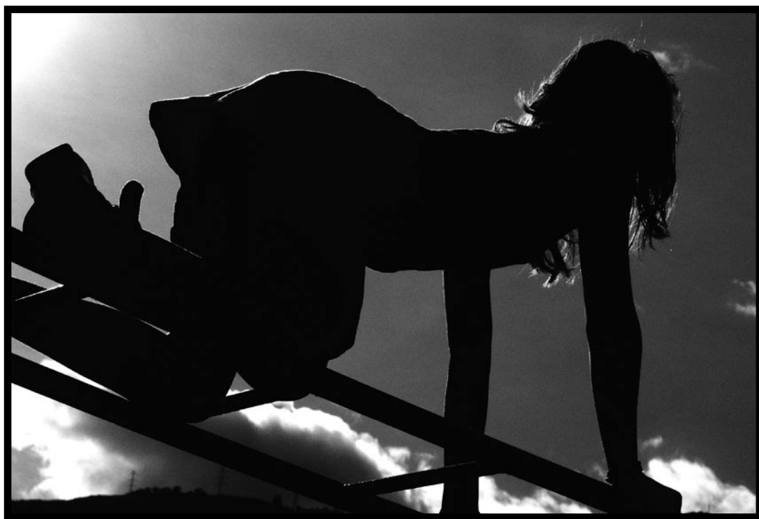
Autor: Patricia Páez / La Pedregosa, Mérida Junio 2005 / Sony CyberShot / Digital