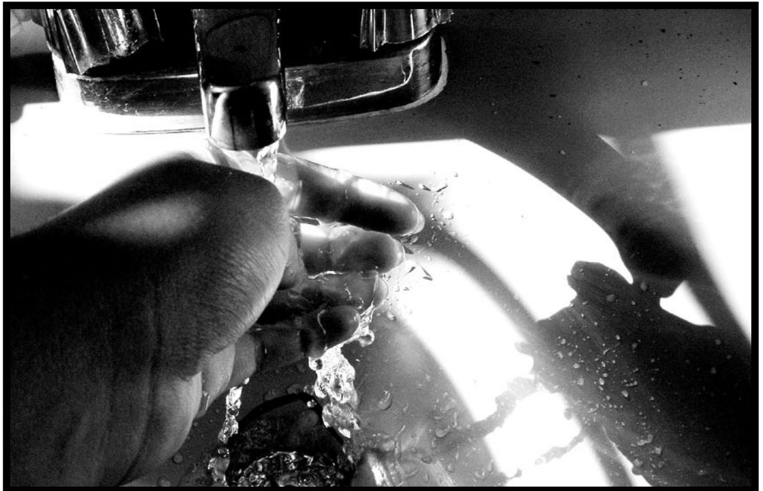
Autor: Salomé Fuenmayor / Agua 2006 / Fujifilm Finepix 3200 / Digital