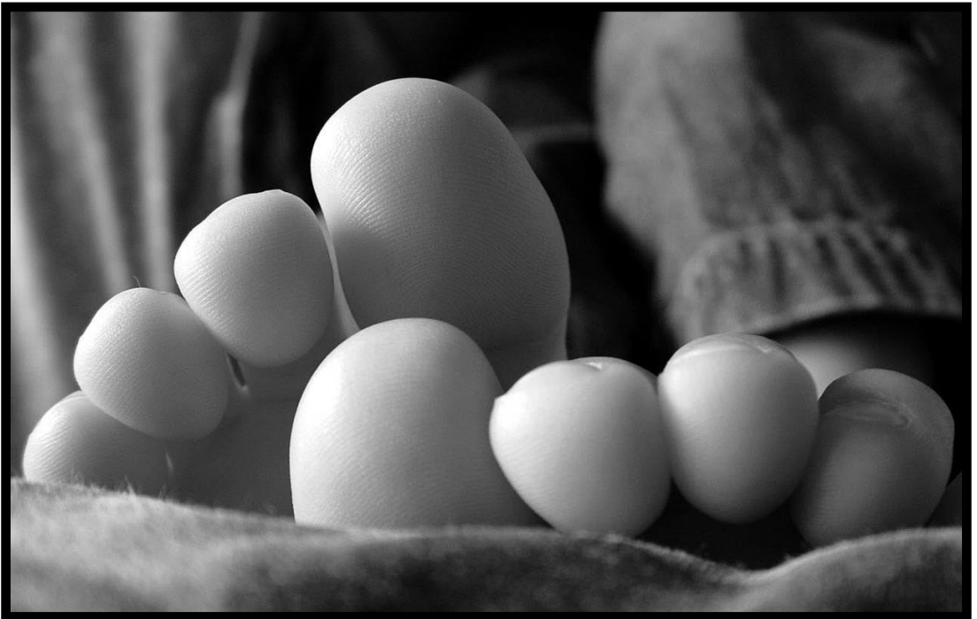
Autor: Salomé Fuenmayor / Carmencita 2005 / Fujifilm Finepix 3200 / Digital