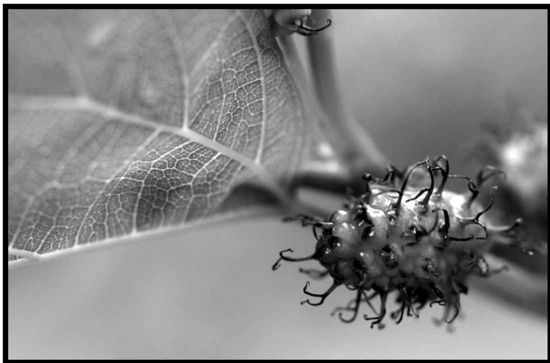
Autor: Gabriel Fuchs / Casi Mora Marzo 2006 / Canon 20D / Macro Digital