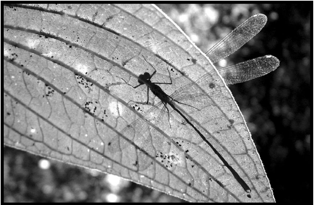
Autor: Salomé Fuenmayor / Aeshna 2006 / Fujifilm Finepix 3200 / Digital