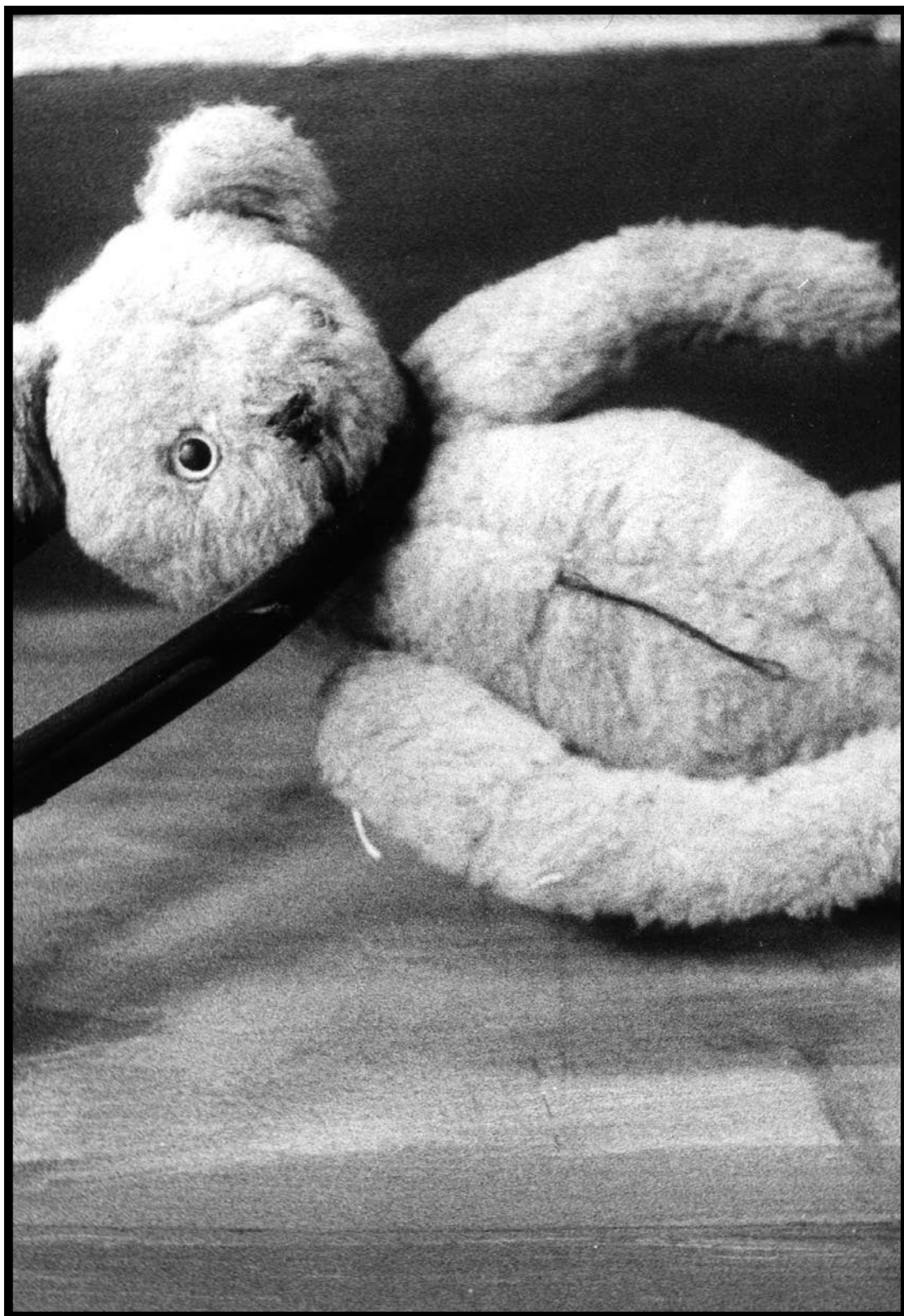
Autor: Alin Koteich Khatib / Inversión 2006 / Analógica Canon AE1 / Película B/N 400 asa