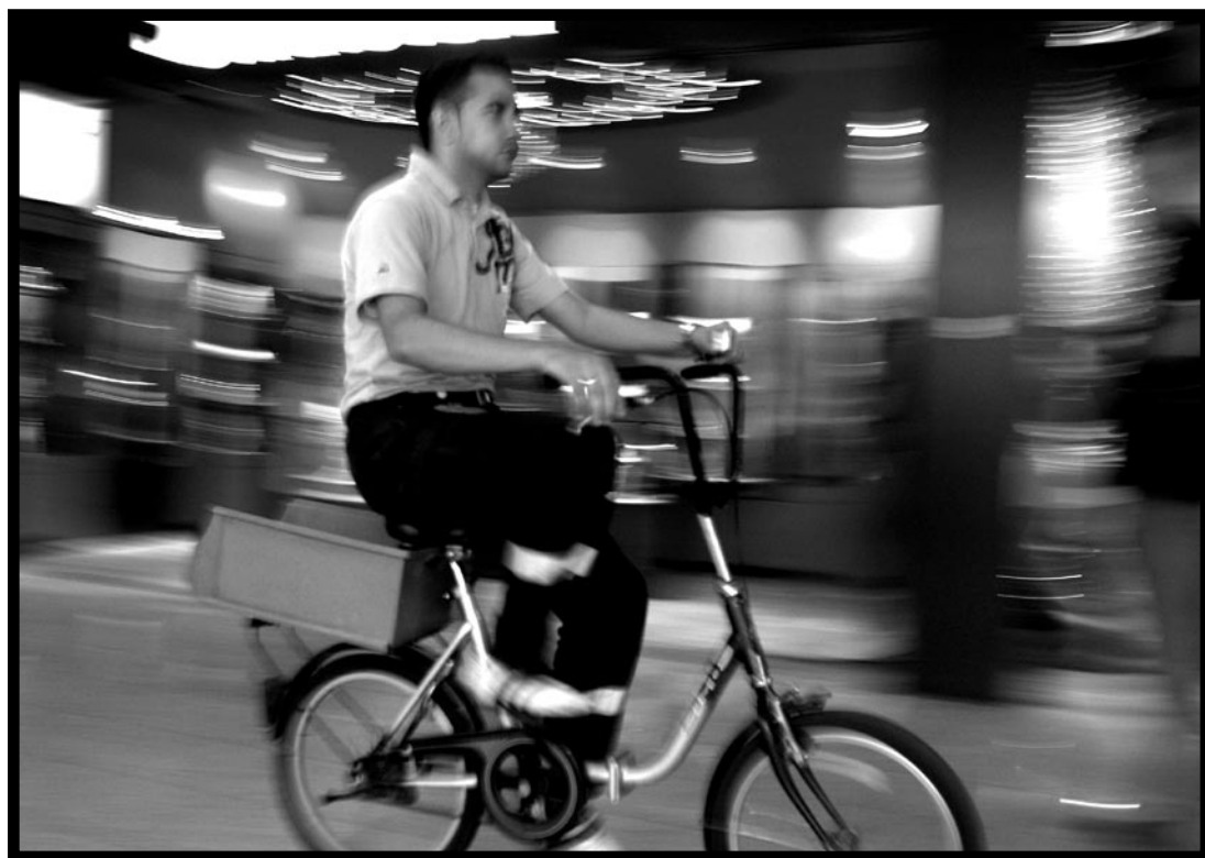
Aeropuerto de Frankfurt Julio 2006 / Sony CyberShot / Digital