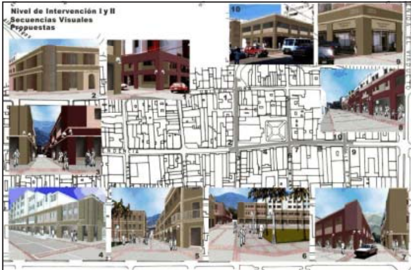
Nivel de Intervención II Secuencias Visuales Propuestas