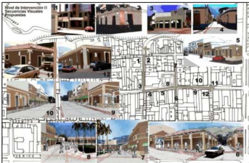
Nivel de Intervención II Secuencias Visuales Propuestas