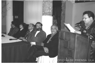
OFICINA DE PRENSA ULA